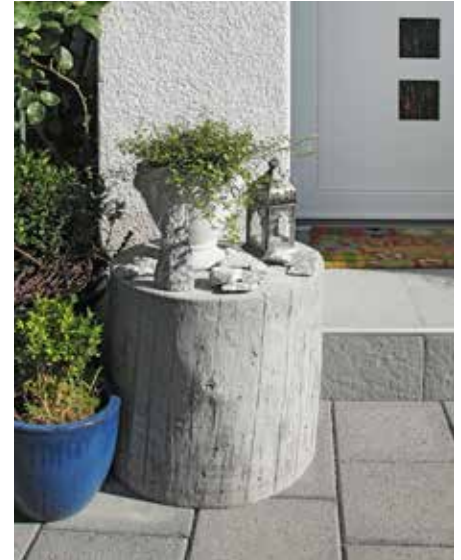
Verblüffend echte Holzoptik.