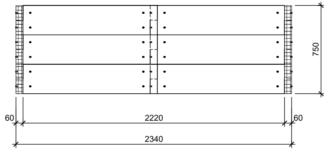
Schnitt 1-1 1:20