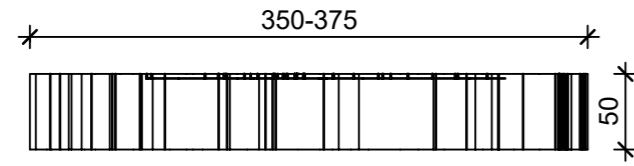
Schnitt 1-1, 1:5